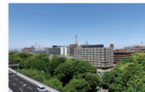
相談室からの風景

事前研修やフォローアップ研修などにより、子ども若者支援に関するマインドやスキルを学んでいます。