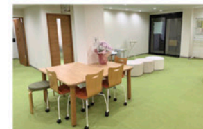
金山ランチ待合ロビー